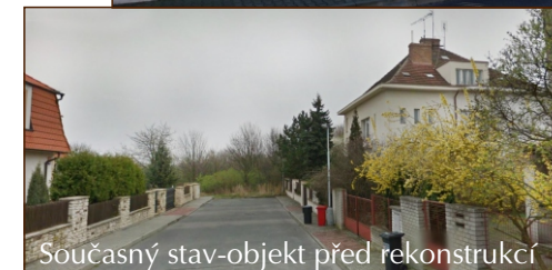
Současný stav-objekt před rekonstrukcí